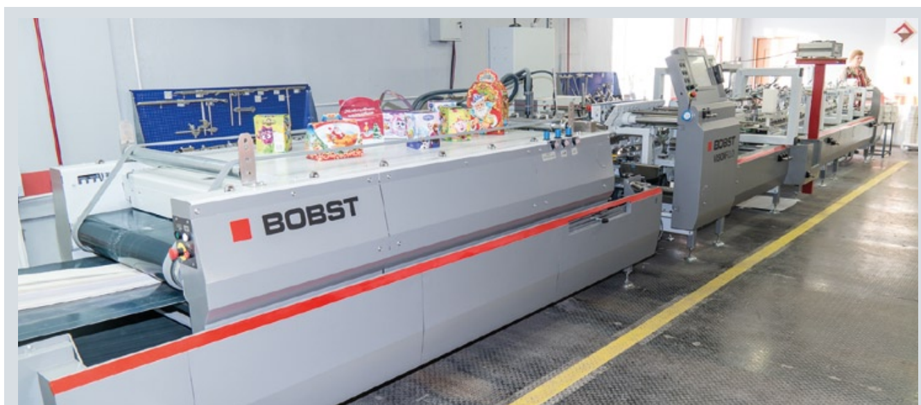
Новинка «Люксупак» — фальцевально-склеивающая линия Bobst Visionfold 110A2

Надо сказать, что сейчас одна KBA Rapida 105 с большим запасом справляется с тем объемом, который раньше печатался на нескольких машинах. То же самое произойдет и с фальцевкой-склейкой. Надо сказать,