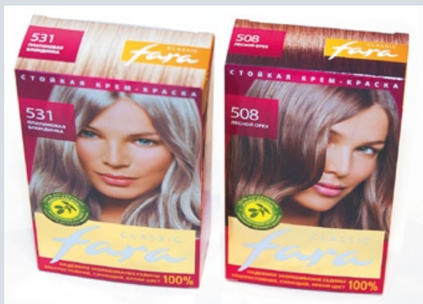
Существенной долей заказов типографии «Люксупак» стала парфюмерно-косметическая и другая сложная упаковка

сразу была запущена с тем уровнем производительности, который обещала компания Bobst. Теперь мы готовы к максимальной загрузке и ждем больше заказов. И в дальнейшем нашем развитии мы будем использовать оборудование Bobst: нам нужно обновлять вырубные прессы, нужно тиснение. В общем, если все пойдет по плану, то через какое-то время будет новый повод для нашей встречи.