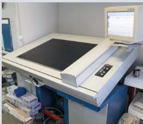
KBA Rapida 105 значительно расширила возможности типографии и вывела ее на новый уровень